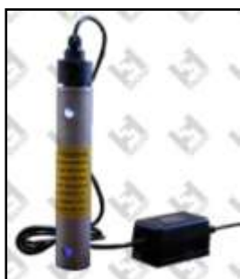
SUV3 300 l/h

Vi invitiamo a contattarci per individuare il sistema più adatto al Vs. caso specifico.