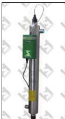
SUV 25/1S 2500 l/h