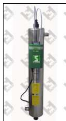
SUV 50/2S 5000 l/h